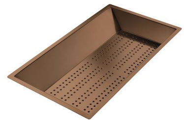
Cuvette perforée en acier inoxydable PVD Copper 8151 008 * uniquement en combinaison avec l'accessoire 8644 101